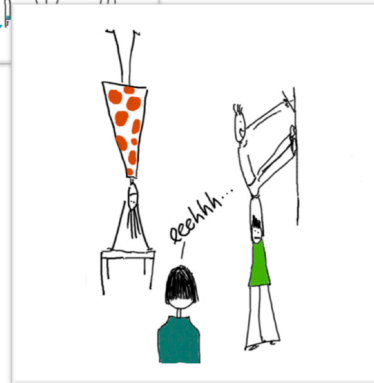
Pedagogisch handelen in klassensituaties