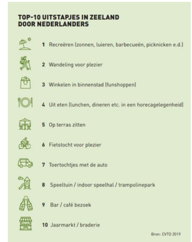
Afbeelding 1: top 10 uitstapjes in Zeeland door Nederlanders, 2019

Of de vervoerskeuze per activiteit beïnvloed wordt door corona zal op de volgende pagina gepresenteerd worden.